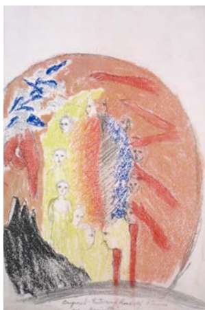
Goetheanum West-Treppenhaus / Rudolf Steiner, Der Kreis der Zwölf - O

Das Werk wird im Goetheanum erstmals in seiner Ganzheit ausgestellt. Über einen Zeitraum von neun Monaten können die Bilder im Zusammenhang mit den Bauformen des West-Treppenhauses betrachtet werden.