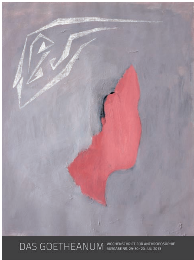
Hannes Weigert, Bild Nr. 4 "Das Goetheanum", 20. Juli 2013